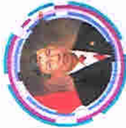
Prof. Dr. Ir. H. Gusti Muhammad Hatta, MS