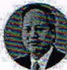
Prof. H. Mohamad Nasir, Ph.D., Ak. Menteri Riset, Teknologi dan Pendidikan Tinggi (to be confirmed)

Lembaga Penelitian Universitas Pendidikan Ganesha (Lemlit Undiksha) telah berhasil melaksanakan SENARI I di tahun 2013 dan SENARI II pada tahun 2014. Pada tahun 2015 ini, Lemlit Undiksha akan menyelenggarakan kembali kegiatan serupa dalam dua format, yaitu Seminar Nasional Riset Inovatif ke-3 (SENARI III) dan The 1 st International Conference on Innovative Research Across Disciplines (1 st ICIRAD). Kedua kegiatan ini memayungi hasil-hasil penelitian bidang pendidikan, sosial, humaniora, serta sains dan teknologi yang akan dilaksanakan pada tanggal 18-19 Nopember 2015 bertempat di Hotel Grand INNA Kuta, Bali. SENARI ini adalah wadah peneliti untuk mempublikasikan hasil-hasil penelitiannya yang inovatif, unggul, dan berkarakter dalam rangka memperkuat jati diri bangsa. Sementara itu, the 1 st ICIRAD digagas dengan tujuan untuk menyediakan forum bertaraf internasional bagi peneliti, pendidik, praktisi, dan profesional dari beragam disiplin ilmu untuk bertukar informasi, ide, serta hasil penelitian tingkat lanjut.